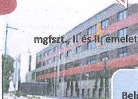
mgfszt., II és III. emelet