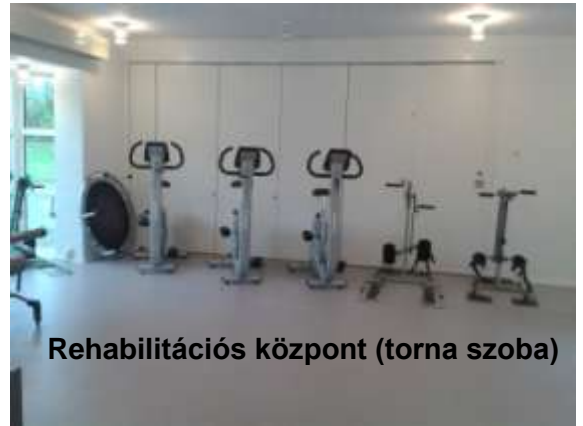
Rehabilitációs központ (torna szoba)