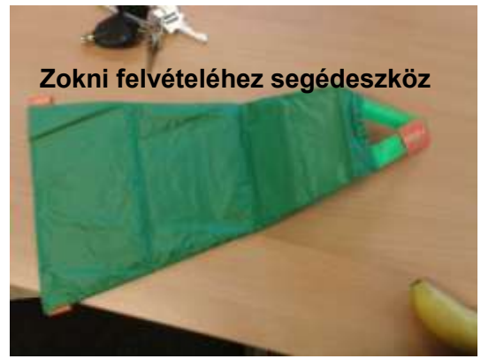
Zokni felvételéhez segédeszköz