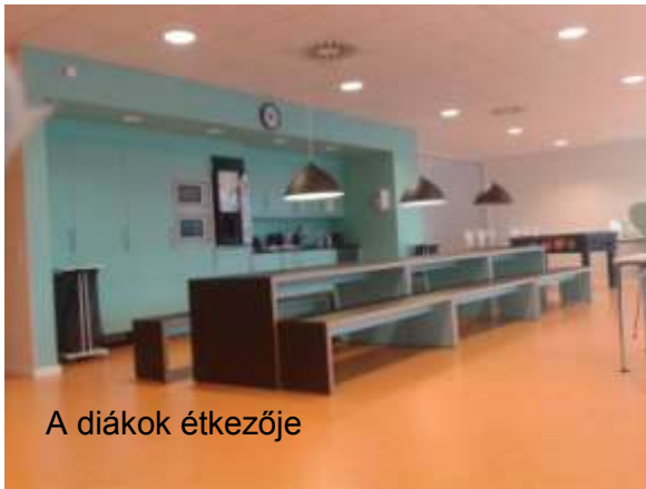
A diákok étkezője