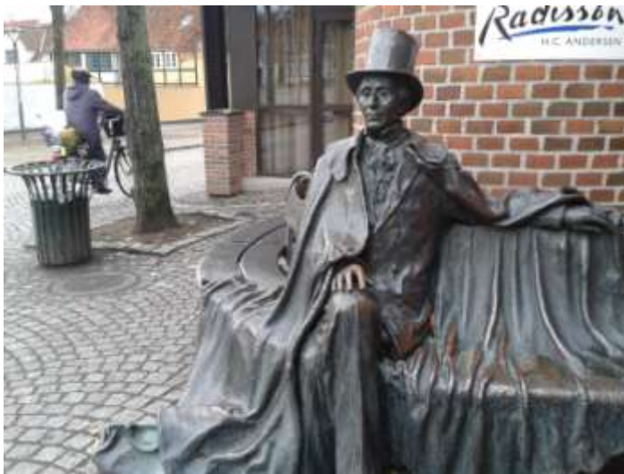
Hans Christian Andersen