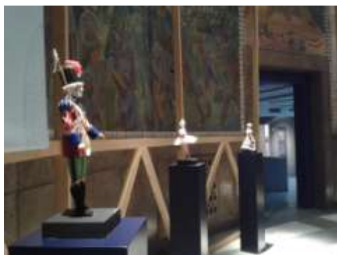
Hans Christian Andersen múzeuma