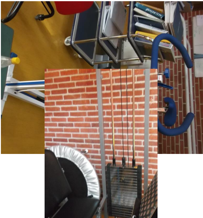
Szobabicikli, futópad, súlyzók a konditeremben.