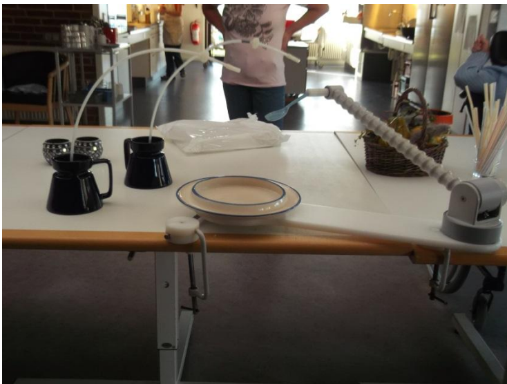
Az etetőgép és eszközei.