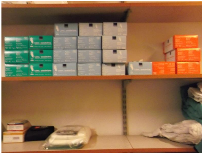
Kötszerek fajtánként és méretként osztályozva.