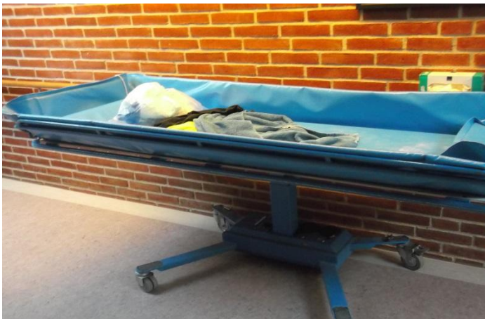
A fürdető ágy. A beteget betegemelő szerkezettel mozgatják.